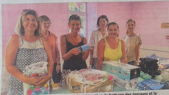
Les membres de l'association ont assuré la préparation du balisage des parcours et la préparation des lots pour la tombola...

Pour la 3 e édition de la rando cyclotouriste du dimanche 4 septembre, l'association qui vient en aide aux enfants malades, "Pédalons pour eux", proposera quatre circuits au départ du stade de football, de 8 h à 11 heures 30. Les amateurs de la petite reine pourront ainsi s'aguerrir sur les routes et chemins de la Drôme des Collines et de l'Isère voisine.