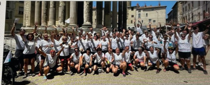
Le départ a été donné samedi 18 juin devant le temple d'Auguste et Livie à Vienne.

Eux, ce sont les enfants malades, atteints de leucémies ou autres dramatiques pathologies. Leurs défis : combattre la maladie. Celui de l'association est de pédaler pour eux, en récoltant des dons pour les reverser aux autres associations aidant